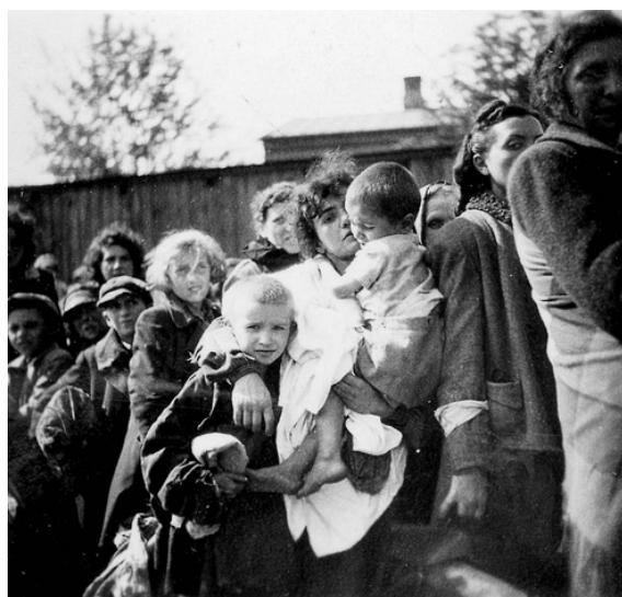
Déportation des Juifs du ghetto. Ghetto de Szydlowiec, 1942.