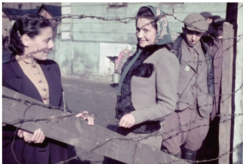
Ghetto de Kutno, 1er avril 1940.

Le ghetto est liquidé fin mars-début avril 1942, quand ses habitants sont envoyés au camp d'extermination de Chelmno.