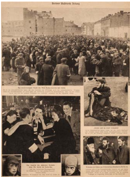
« Les Juifs entre eux » Berliner Illustrierte Zeitung , 24 juillet 1941. Collection particulière

meurent d'inanition. La brutalité juive est dénoncée par la juxtaposition des images, par des textes explicites (« Les pauvres meurent de faim, les riches se gobergent ») et par des misés en scène choquantes – un couple d'élégants sort d'un spectacle pendant que, sur le trottoir, agonise un jeune homme.