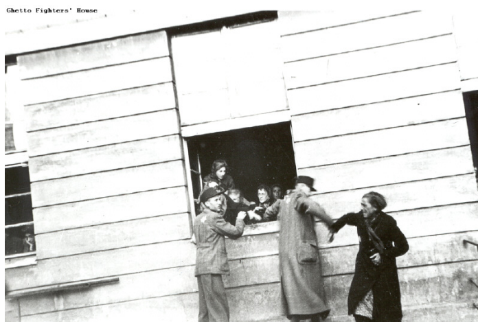
Lors de l'action du couvre-feu, un policier Juif, venu prendre les enfants en bas âge, malmène une femme qui tente de s'opposer. Ghetto de Lodz, 10 septembre 1942.