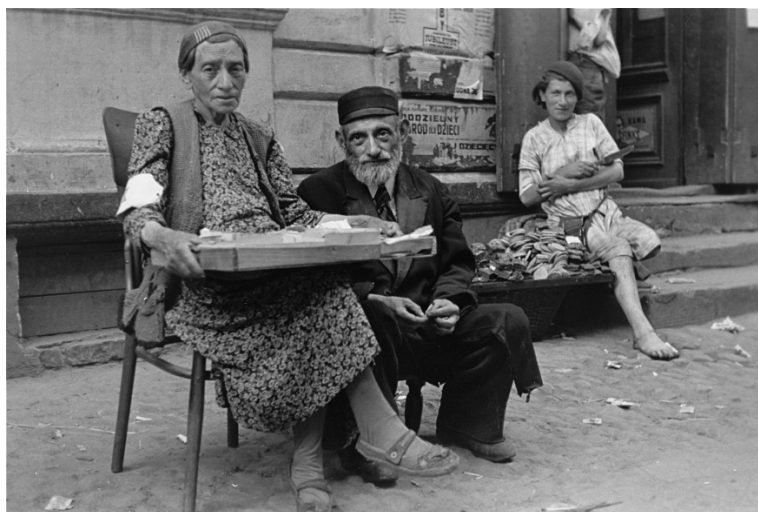
Un couple âgé vendant quelques effets. Ghetto de Varsovie, été 1941.