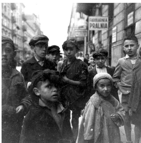
Enfants trainant dans la rue, en arrière-plan l'enseigne de blanchisserie. Ghetto de Varsovie, 19 septembre 1941.