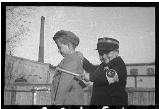
Des enfants jouent au gendarme et au voleur : le petit garçon à droite porte un déguisement de policier juif. Image tirée à partir du négatif original, reproduit avec permission, 2013.