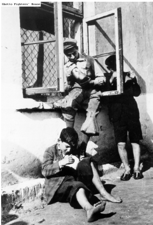
Enfants mangeant devant la fenêtre d'une cantine publique. Ghetto de Lodz, ca 1940-1944.

Création du ghetto : 1 er mai 1940. Situé dans la région du Reichsgau Wartheland . Population du ghetto en mai 1940 : 165 000 personnes. Principales déportations vers le camp de Chelmno. Liquidation du ghetto en août 1944 avec la déportation vers Auschwitz des quelque 65 000 Juifs qui s'y trouvaient encore.