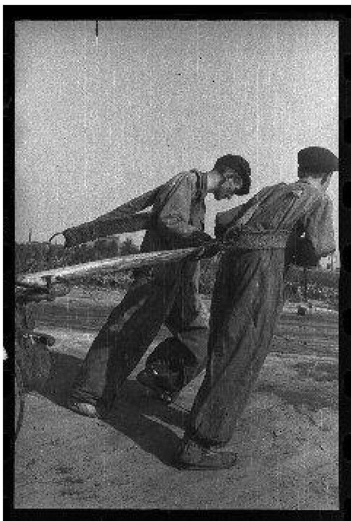
Deux travailleurs du commando chargé de transporter les containers de matières fécales à l'extérieur du ghetto. Ghetto de Lodz, Pologne, ca. 1940-1944. Image tirée à partir du négatif original, reproduit avec permission, 2013.