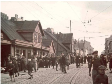
Scène de rue, ghetto de Lodz. Ca 1940-1944.

La création de ghettos pour les Juifs d'Europe orientale n'est pas le résultat d'une politique planifiée à l'avance. Certes, dès la fin des années 1930, certains dirigeants nazis (Heydrich, Göring et Hess) se sont penchés sur la nécessité de séparer totalement les Juifs allemands du reste de la société, mais ces idées ont été immédiatement abandonnées. On pensait alors que l'opinion allemande n'accepterait pas l'idée de ghettos et que, de surcroît, cela serait techniquement irréalisable. Mais après l'invasion de la Pologne en 1939, des centaines de ghettos sont progressivement mis en place pour y concentrer les Juifs du pays et, à partir de 1941, les Juifs des territoires conquis en Union Soviétique.