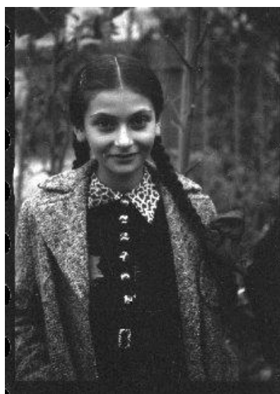
Petite fille dans un jardin. Ghetto de Lodz, ca. 1940-1944. Don anonyme 2006. Image tirée à partir du négatif original, reproduit avec permission, 2013.