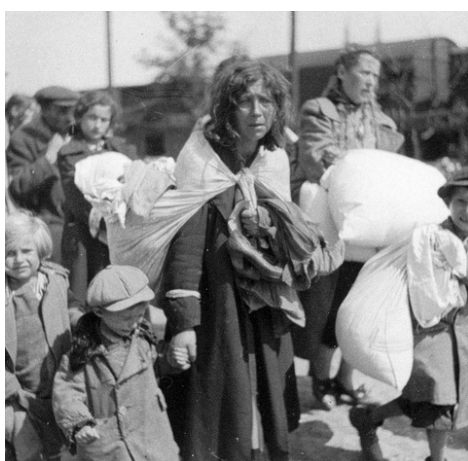
Déportation des Juifs du ghetto. Ghetto de Szydlowiec, 1942.