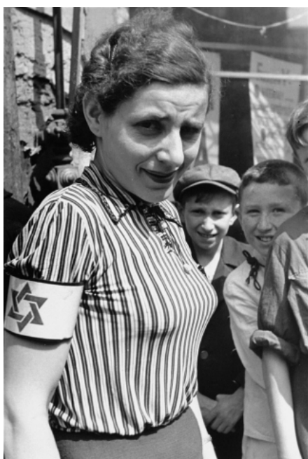
Portrait d'une femme portant un brassard. Ghetto de Varsovie, été 1941.