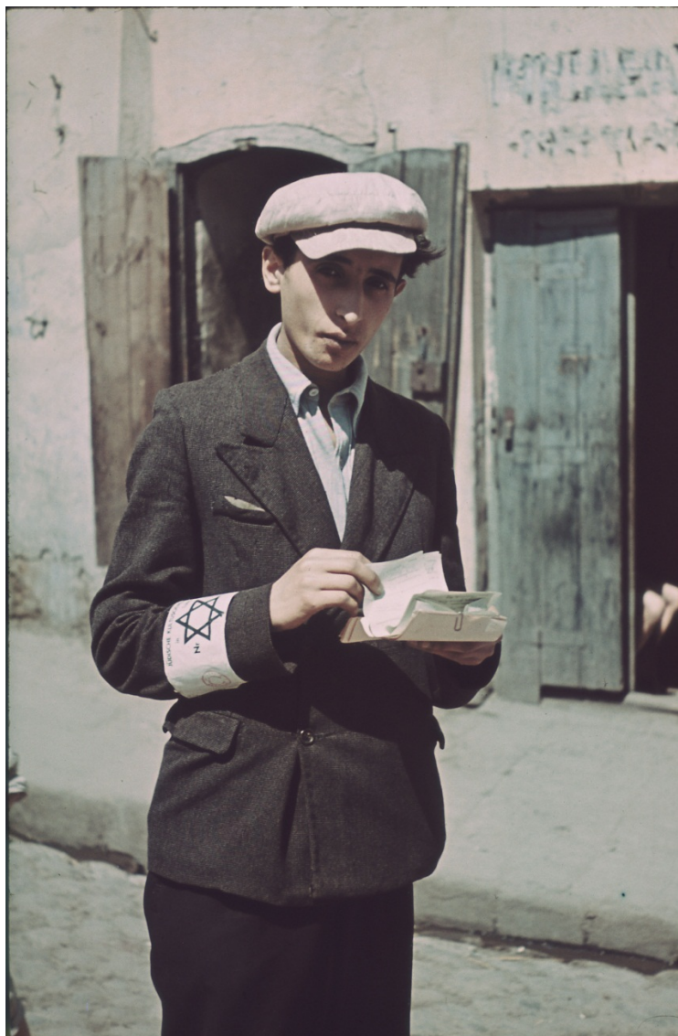
Jeune homme avec un brassard à l'étoile de David dans le quartier juif de Lublin. Ghetto de Lublin. 1940. M. Kirnberger. © Deutsches Historisches Museum, Berlin.

Quand éclate la Seconde Guerre mondiale près de 40 000 Juifs vivent à Lublin, soit environ 1/3 des habitants de la ville. Les portes du ghetto se referment le 24 avril 1941, 34 149 Juifs y sont confinés. Le ghetto n'est clôturé et entouré de barbelés qu'à la fin 1941. En 1942, les Juifs de Lublin sont les premiers à être envoyés à la mort, dans le cadre de l' Aktion Reinhardt . Dans la nuit du 16 mars, les SS et des gardiens ukrainiens encerclent le ghetto et, le lendemain, des convois de Juifs prennent la direction du centre de mise à mort de Belzec. En l'espace d'un mois, près de 30 000 Juifs du ghetto sont ainsi envoyés à l'extermination.