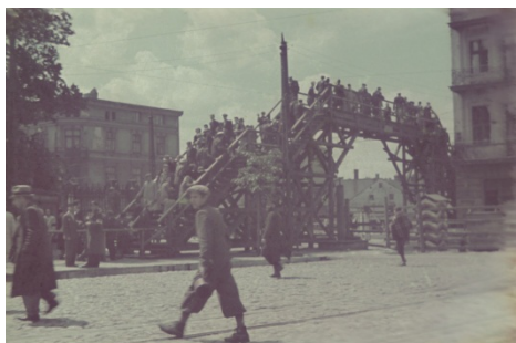
Le pont enjambant la rue Zgierska, place Koscielny. Ghetto de Lodz, 1941.