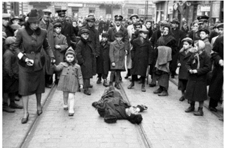
Corps sur les voies du tramway, l'indifférence de la foule est mise en scène par le photographe. Ghetto de Varsovie, été 1941.