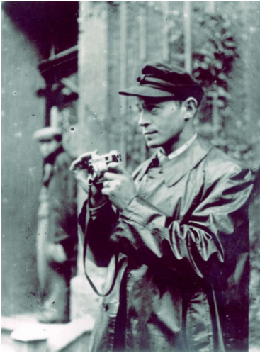
Le photographe George Kadish. Ghetto de Kaunas, 1942.