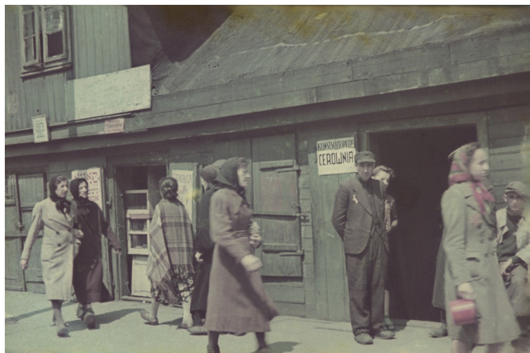
Scène de rue dans le ghetto. Ghetto de Lodz, ca 1940-1944.