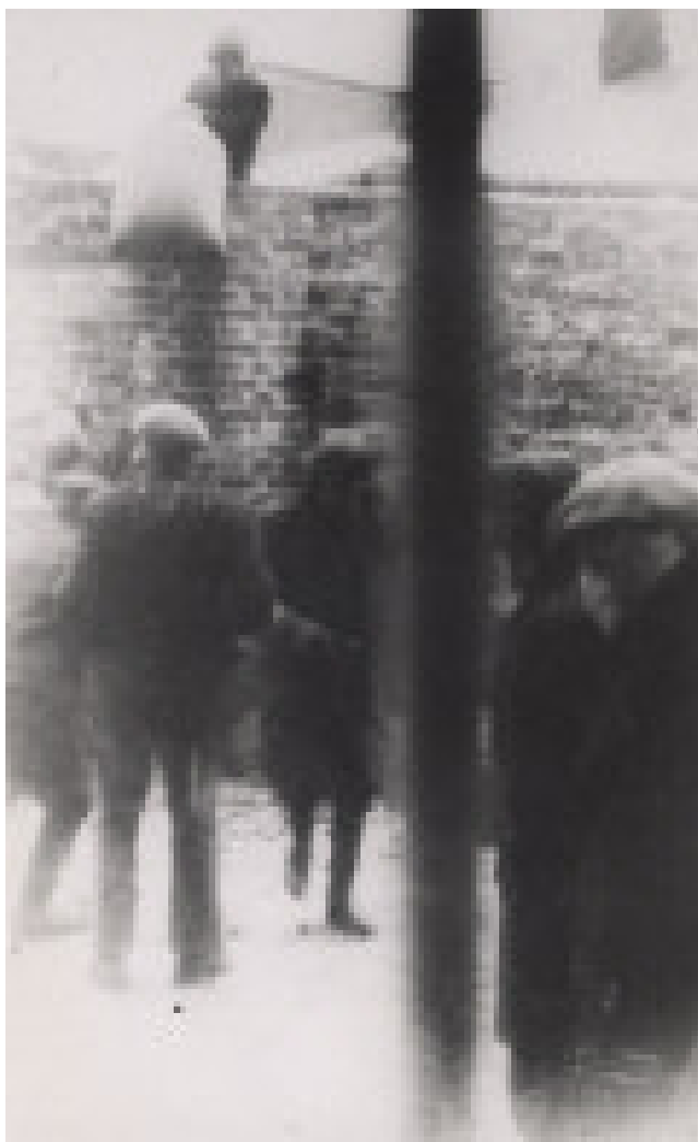
Passage en contrebande de sacs de nourriture par-dessus le mur d'enceinte du ghetto. Ghetto de Varsovie, ca 1940-194.

Il s'agit, au total, de trois ensembles d'archives enterrés à des moments différents, manuscrits, textes dactylographiés, imprimés, polycopiés en yiddish, en hébreu, en polonais et en allemand, documents administratifs, et quelques photographies dont les auteurs restent inconnus.