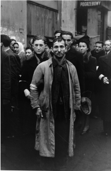
Groupe d'hommes juifs ôtant leur chapeau devant le photographe allemand. Ghetto de Varsovie, été 1941.

L'exposition phare du Mémorial de la Shoah du 13 novembre 2013 au 28 septembre 2014