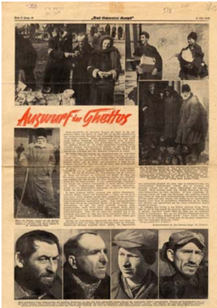
« Se débarrasser des ghettos » Das Schwarze Korps , 2 mai 1940.

Les photographies et films nazis présentent les ghettos - que les autorités du Reich ont elles-mêmes érigés - en conservatoires de la hideur et de la maladie juive. Le journal de la SS, Das Schwarze Korps présente en mai 1940 des Juifs considérés comme emblématiques : de préférence laids, généralement marqués par la fatigue et les privations, corps et visages sont censés montrer et démontrer l'altérité absolue des Juifs. Les portraits en bas de page, pris en gros plan et de trois quarts, rappellent les photographies d'identité judiciaire. Le commentaire se livre à une expertise raciologique des spécimens présentés : le « mélange racial », affirme le texte, est « bien révélé » par « des traits négroïdes, ostiques et sémitiques », qui « montrent clairement » que l'on a ici affaire à des monstres esthétiques, mais aussi éthiques, car ces gens, lit-on, ont un « regard mauvais » qui « fuient tout face-à-face ».